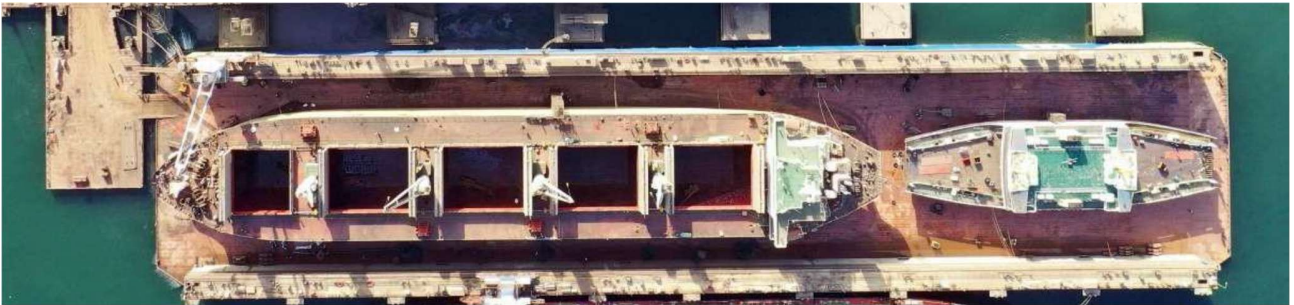
ŞEKİL 2. TERSAN'IN MEVCUT TESİSLERİNE GENEL BAKIŞ